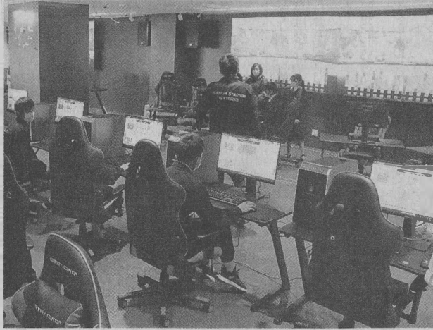
eスポーツの企業チーム対抗戦の本戦が行われるサンガスタジアム京セラ内の専用施設（亀岡市）