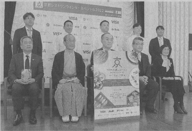
京都レストランウィンタースペシャルをPRする実行委員会のメンバーら（京都市中京区・市役所）

京都の老舗料亭や人気レストランが期間限定メニューを共通価格で提供する「京都レストランウィンタースペシャル2022」が来年1月8日〜3月18日、京都市内を中心に行われる。13回目となる今回は初めて観光キャンペーン